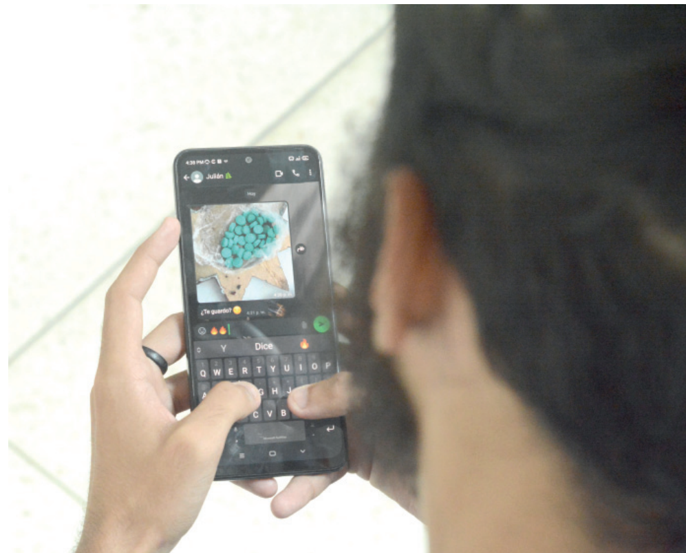
Hay quienes consumen engañados por quienes minimizan sus afectaciones.

A nivel global se le considera una droga de iniciación entre los jóvenes, que hace función de trampolín hacia el abismo de otras sustancias aún más peligrosas.