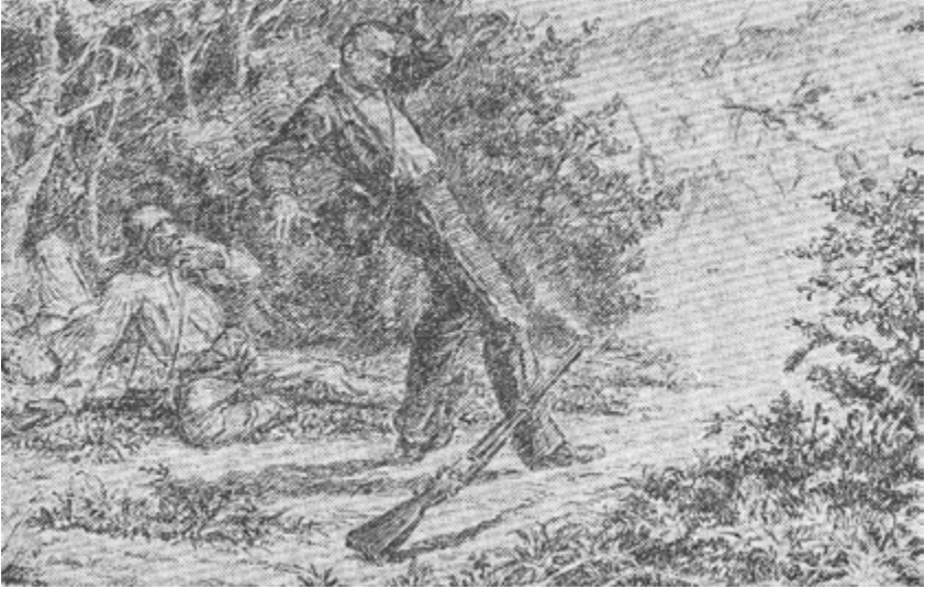
Caída de Flor en combate, en Alto de Palmarito, 10 de abril de 1895.

Sin tiempo para morir, nos dejó el siguiente mensaje convertido en proclama y testamento político para las futuras generaciones: