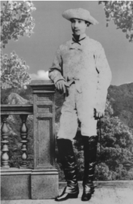
Flor en Kingston, después de Baraguá, 24 de julio de 1878.