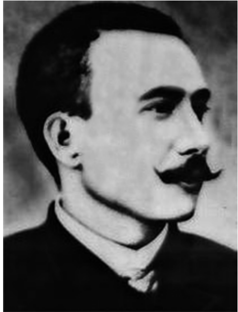
Flor en Centroamérica.