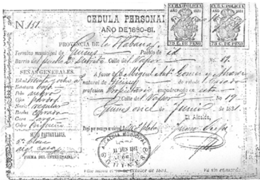
Cédula personal 5a. clase.